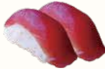
MAGURO tonno € 3,00