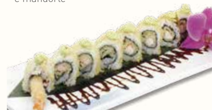
TEMPURA ROLL € 10,00

cetrioli e avocado con salmone affumicato e tobiko all'esterno