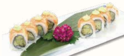
CARCIOFI ROLL € 12,00 carciofi in tempura con salmone e salsa avocado