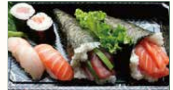
SUSHI TEMAKI € 10,00