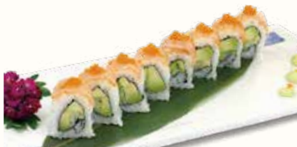
SMOKE ROLL € 12,00

salmone e avocado con pesce misto e salsa sriracha all'esterno