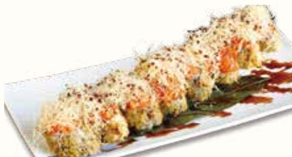
BOMBER ROLL € 10,00 maki fritto con spicy sake e pasta kataifi fritto all'esterno