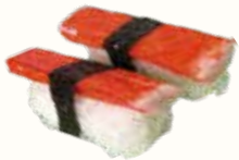
SURIMI polpa di granchio € 2,00