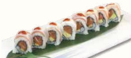
RAINBOW SPECIALE € 12,00

gambero fritto avvolto con salmone scotatto e mandorle