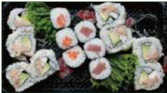
MAKI MISTO € 10,50