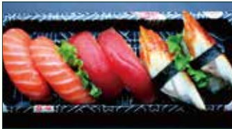
SUSHI MONO € 7,00