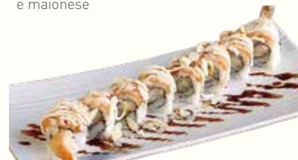
TIGER SPECIALE € 12,00

salmone, avocado avvolto con amaebi, avocado e tobiko