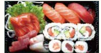
SUSHI SASHIMI €14,00