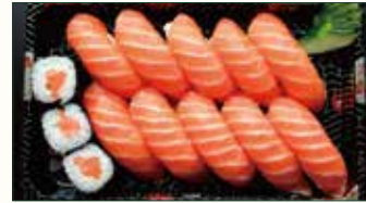
SUSHI SAKE € 10,50