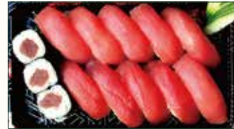
SUSHI MAGURO € 14,00