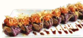
IRIS € 10,00 riso venere con salmone philadelphia e spicy salmon patatine e salsa teriyaki all'esterno