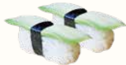
AVOCADO avocado € 1,50