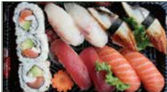
URA SUSHI € 11,50