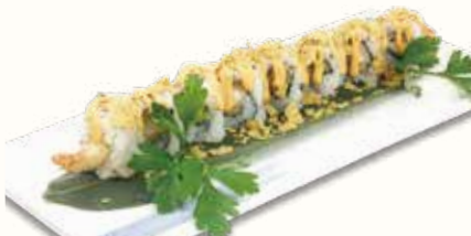
NACHOS ROLL € 11,00 gamberi in tempura con nachos e salsa maionese piccante