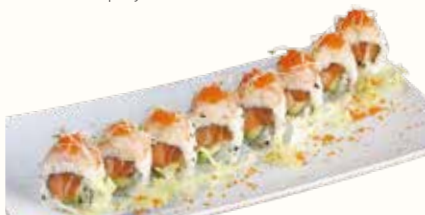
LEMON ROLL € 13,00

salmone e avocado avvolto con mango e pistacchio in pezzi