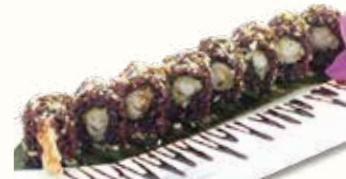
EBITEN BLACK € 9,00 riso venere con tempura di gamberi, patatine e teriyaki