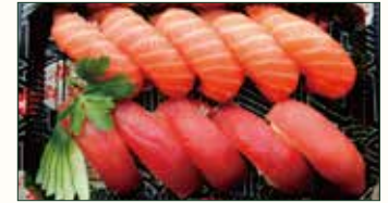
SUSHI SAKE MAGURO €12,50