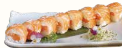
FRESH ROLL € 10,00 salmone con salmone sopra