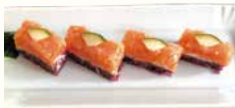
OSHIBAKO € 13,00 rettangolini di riso venere con salmone tritato, philadelphia e lime