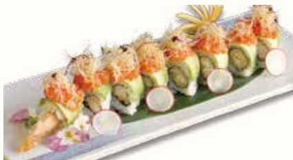
COSMOPOLITAN € 12,00

salmone, avocado, sopra con avocado, mango a cubetti e philadelphia