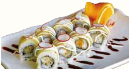
SAUCE ROLL € 10,00 gambero fritto avvolto con avocado, salsa teriyaki e maionese