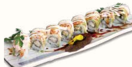
SAKURA ROLL € 12,00

gamberi in tempura avvolto con avocado salmone spicy e kataifi