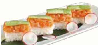
SAUDATE € 13,00 rettangolini con salmone tritato e avocado