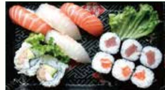
HOSSO SUSHI € 9,50