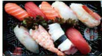
SUSHI MISTO €10,50