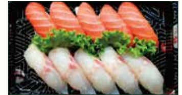
SUSHI SAKE SUZUKI €11,50