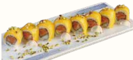
MANGO ROLL € 13,00

gambero fritto avvolto con avocado, surimi e maionese