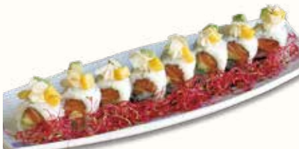
SWEET ROLL € 10,00

salmone, avocado, sopra con avocado, mango a cubetti e philadelphia