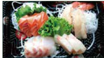
SASHIMI MISTO €11,50