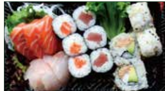
MAKI SASHIMI € 13,00