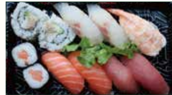
SUSHI MAKI € 10,50