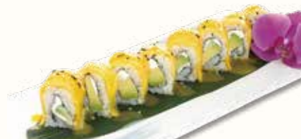
MANGO SPECIAL € 12,00 avocado e philadelphia avvolto con mango e salsa mango